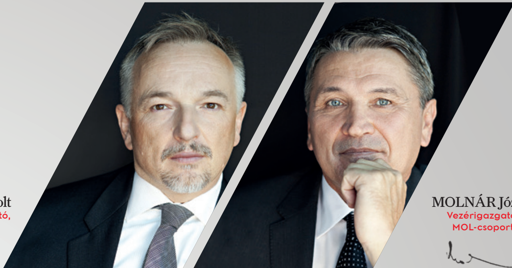
MOLNÁR József Vezérigazgató, MOL-csoport